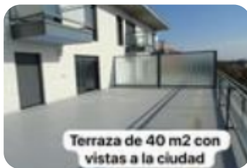
Terraza de 40 m2 con vistas a la ciudad