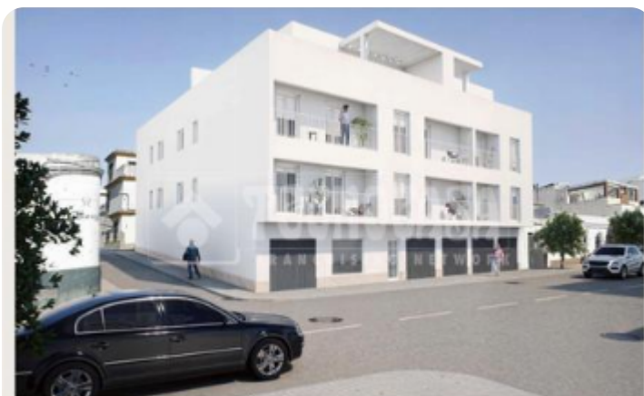
NUEVA PROMOCIÓN DE VIVIENDAS Y GARAJES