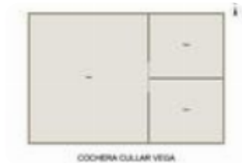
COCHERA CULLAR VEGA

Abre el QR para más información sobre el inmueble